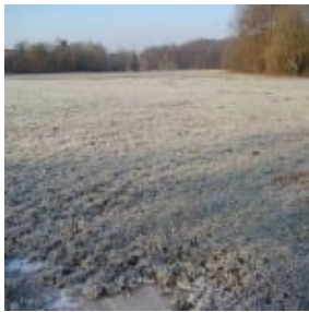
Tobewiese unserer Hunde

Der Spaziergang ist schon eine Weile her. Wir starteten an der Paffrather Mühle. Die Wiese