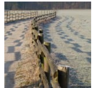
Die Sonne spielt mit dem Zaun

ausruhten und kleine Bäche hatten Eisränder. Auf dem Weg zum Schäferhundeplatz spielte die Sonne mit dem Holzzaun. Unser Weg führte dann in großem Bogen am Mutzbach entlang zurück zum Schlangenberg.