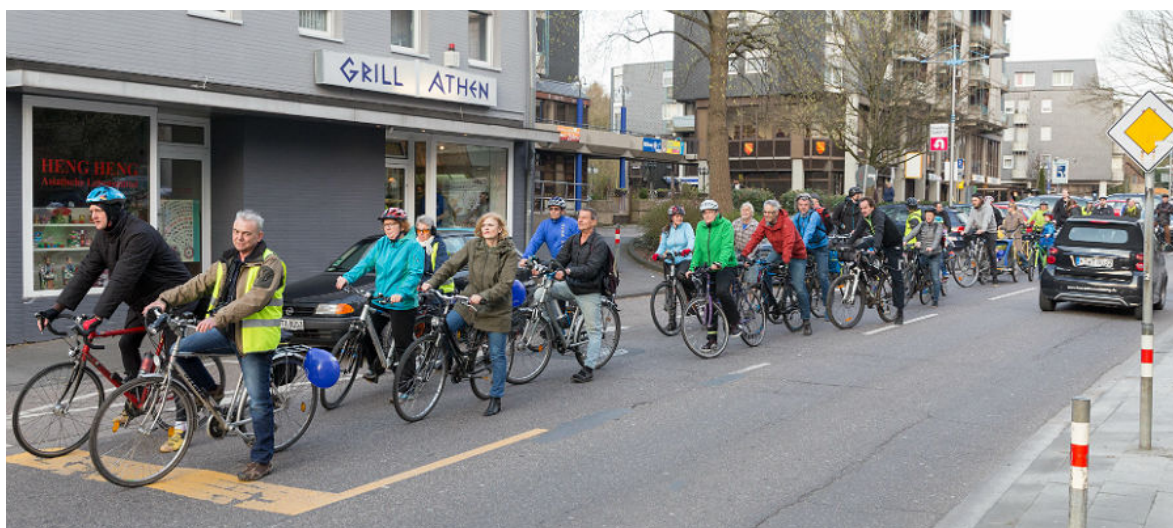
Die erste Critical-Mass-Aktion im April 2016.

Sobald die Webseite fertiggestellt ist, wird dies bekanntgegeben. Dann wird es auch die Möglichkeit geben, per E-Mail mit uns in Kontakt zu treten.