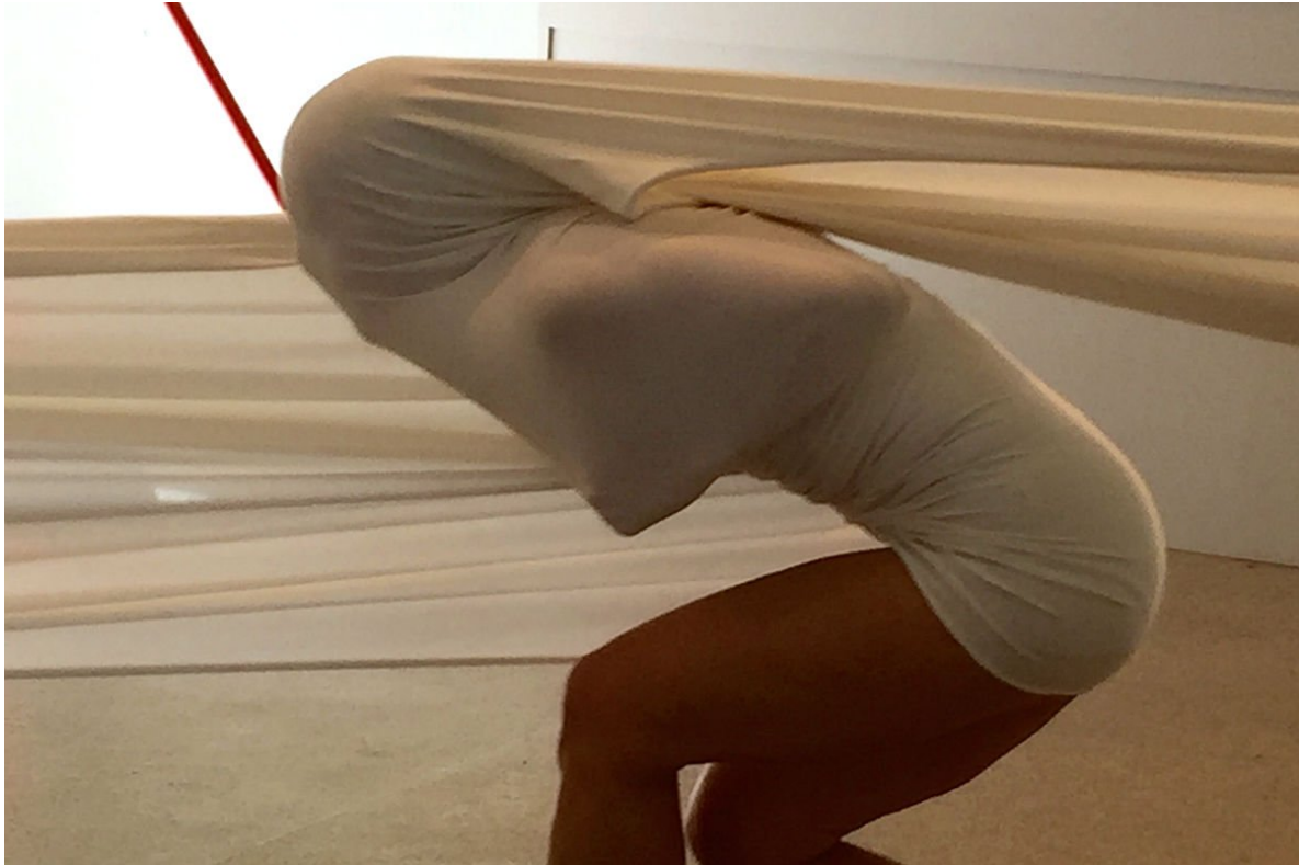
Die Human Dance Company.